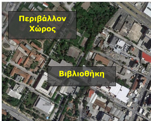
Εικόνα 1: Περιοχή Παρέμβασης

Η περιοχή υλοποίησης των παρεμβάσεων παρουσιάζεται στην παρακάτω εικόνα με επισήμανση των παραπάνω χώρων.